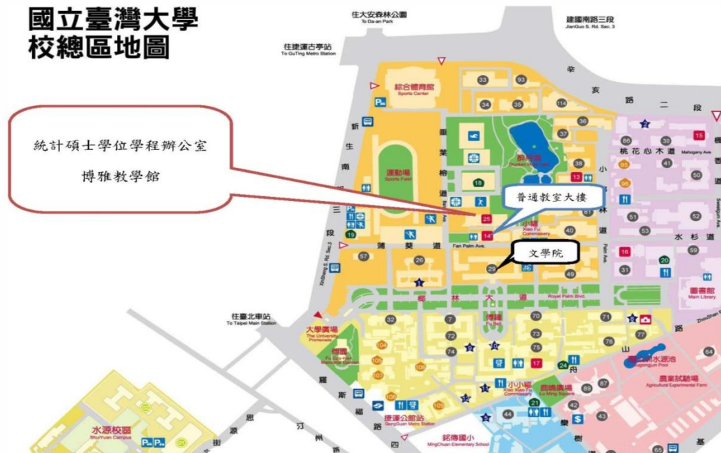
國立臺灣大學 校總區地圖